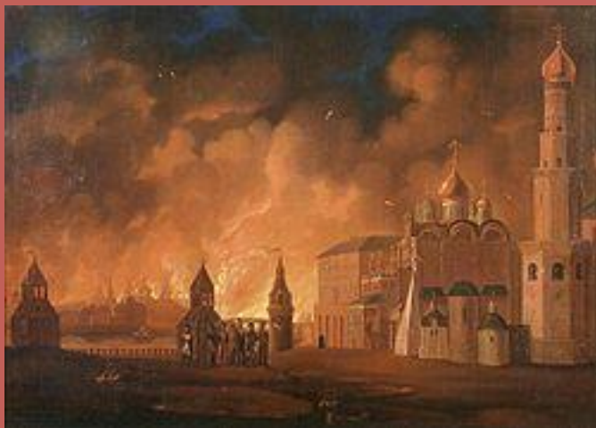
■ Горящая Москва

Поначалу трудно поверить, что через 200 лет в 1812 году единство народа вновь было подтверждено своей мощью, когда остатки Великой Армии Наполеона покидали Россию.